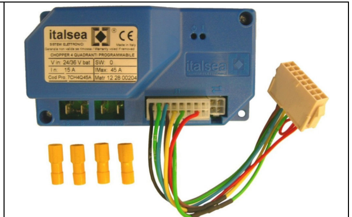
Chopper card Part number 49701160

Take off the old chopper card and assemble the new one positioning it as indicated in picture 3.