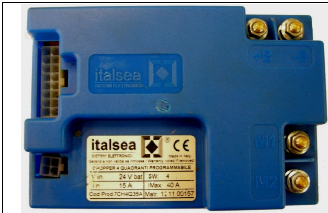
Chopper card Part number 49701010 Assembled up to serial number 12001943