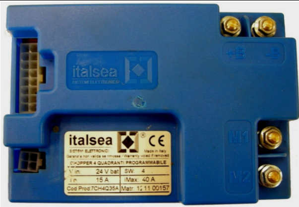
Chopper-Karte Artikelnummer 49701010 Montiert bis zur Maschinenummer 12001943