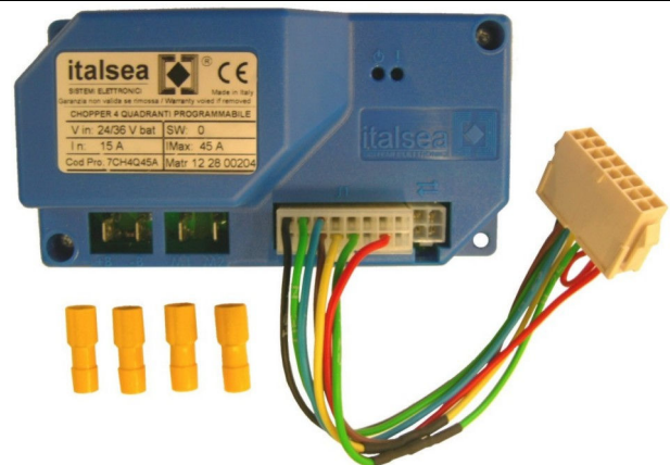
Chopper-Karte Artikelnummer 49701160

Die alte Chopper-Karte herausnehmen und die neue positionieren, wie Abbildung 3.